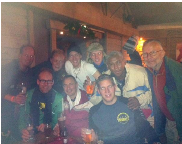
Het bleef nog lang onrustig in Bottrop.....